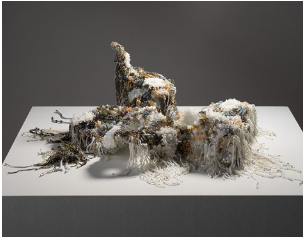
木下結衣《余波》2023年 富山市ガラス美術館所蔵

闇の中に浮かび、またたき、揺らめく光は、謎に満ちた夜の世界への想像力を育んできました。19世紀から現代にかけて、ガラスを素材とした作品は、豊かな象徴性や幻想性を帯びたものとなります。本展覧会では、ガラスならではの光が生み出す影の美しさ、そしてその影が表現する神秘的な夜と闇の魅力に迫ります。