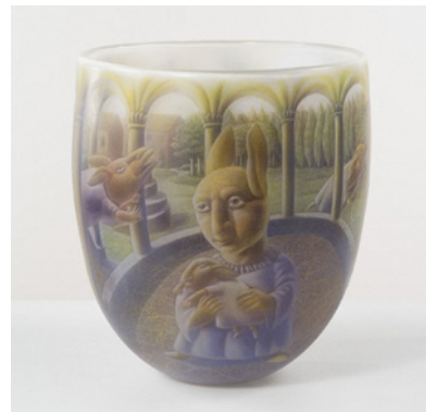
池本一三《SCENE 0202》2002年 富山市ガラス美術館所蔵

本展は1950年以降に制作された現代ガラスアートを中心に、ガラスであるからこそ可能な「えがく」手段や表現、その意義に迫ります。ガラスに直接絵付けを施す作品から、その特性を活かしてガラスそのもので「えがく」作品、さらにガラスそのものを題材として「えがいた」作品など、ガラスと「えがく」の関係性から生まれる多彩な世界をお楽しみください。