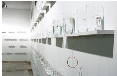
赤松音呂《チジキンタン》2013年 作家蔵 ©赤松音呂 展示風景:OK Center for Contemporary Art [リンツ, オーストリア]

私たちは、偶然に出会う光景から感じた音や光、時間の流れによって、自身の感覚や記憶が呼び覚まされることがあります。その体験は、私たちと目の前の光景との間に思いがけないつながりを生み出します。本展では、見る者の感覚や記憶に作用し、作品世界と積極的な関わりを促すインスタレーションを展開する3名の作家を紹介いたします。