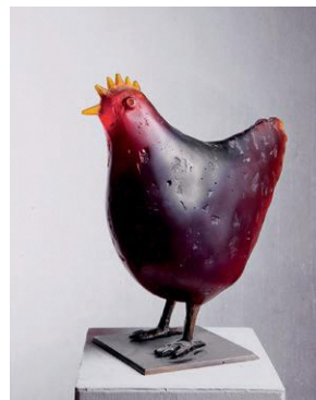
Ivana Šrámková《Slepice / Hen》2016年 作家蔵

チェコの作家イヴァナ・シュラムコヴァ(1960-)は、自身を取り巻く自然や社会から着想を得て、主に人間や動物をモチーフに、キャストの技法によるガラス彫刻、吹きガラスのオブジェや器、そして油絵など様々な手法で作品を制作します。本展では約80点の個性豊かな作品たちを通して、作家の生み出す独自の世界観を紹介いたします。