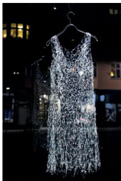
言上真舟《Scent of mist》2017年 作家蔵

出品作家： 伊藤真知子、猪野屋牧子、勝川夏樹、小曾川瑠那 言上真舟、谷口嘉、渡辺知恵美