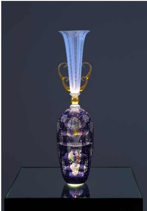
2 安田泰三《虹色パルーン》2017年 作家蔵