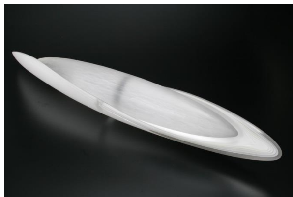
5 川辺雅規《Cocoon～明日への想い～》2013年 作家蔵