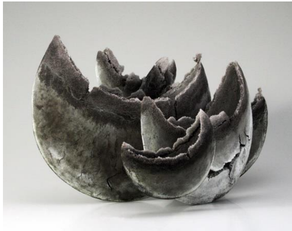
4 津守秀憲《時の狭間 '15-1》2015年 作家蔵