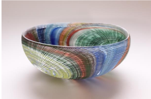
3 佐野曜子《織の大鉢》2015年 作家蔵