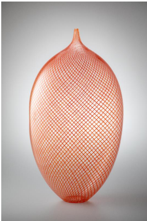
8. リノ・タリアピエトラ 《Reticello》 1999年 Lino Tagliapietra Collection