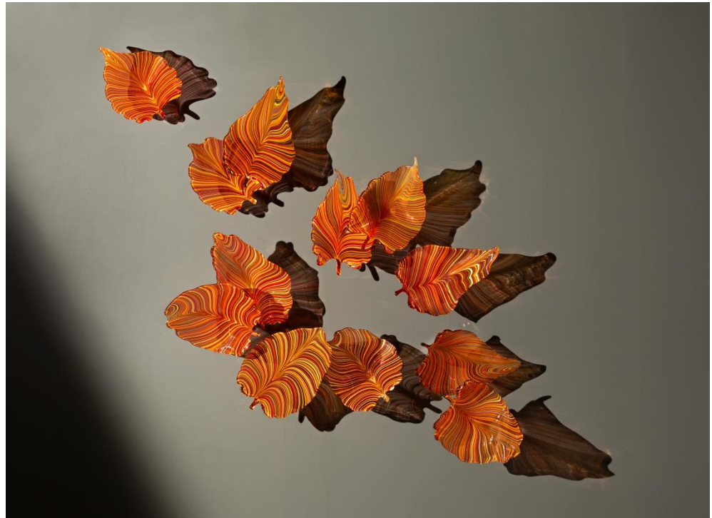
《Secret Garden》2018年 Lino Tagliapietra Collection