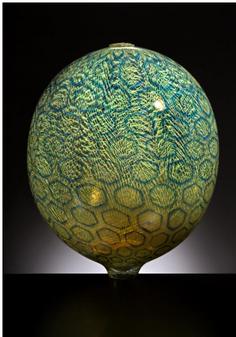
4. リノ・タリアピエトラ 《Africa》 2015年 Lino Tagliapietra Collection