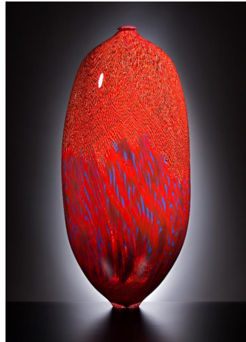
5. リノ・タリアピエトラ 《Africa》 2017年 Lino Tagliapietra Collection