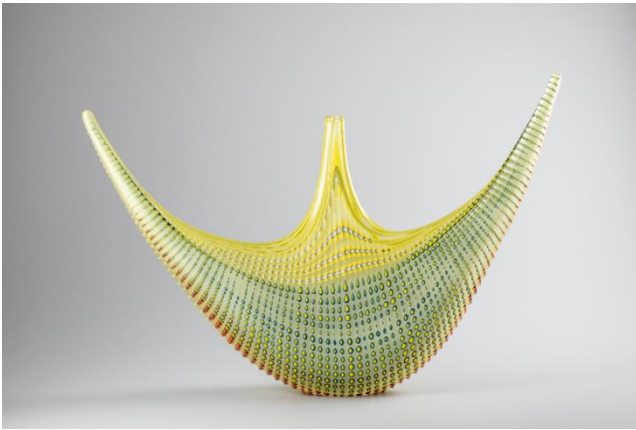
6. リノ・タリアピエトラ 《Batman》 2006年 Lino Tagliapietra Collection