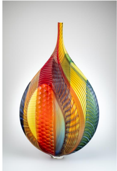
9. リノ・タリアピエトラ 《Mandara》 2005年 Lino Tagliapietra Collection