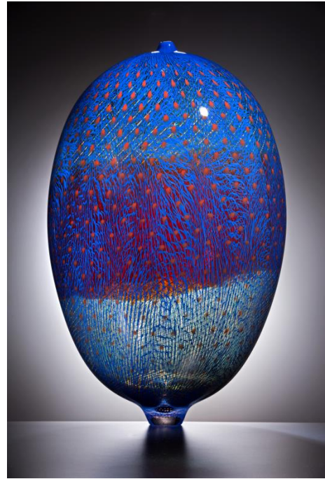
3. リノ・タリアピエトラ 《Africa》 2014年 Lino Tagliapietra Collection