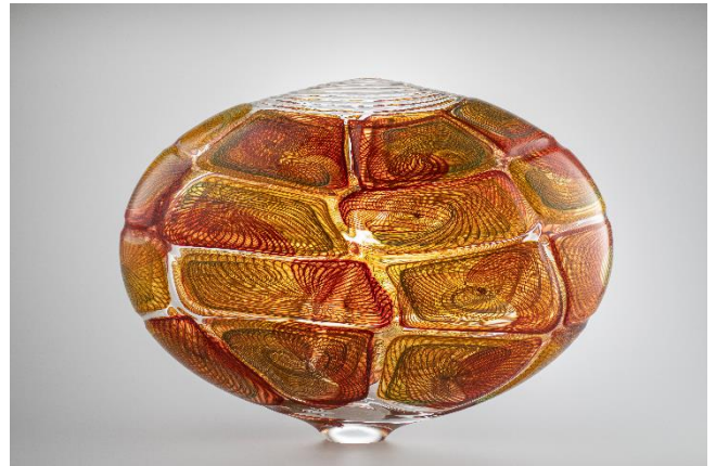
7. リノ・タリアピエトラ 《Kira》 2010年 Lino Tagliapietra Collection